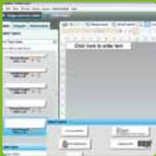
DYMO Label™ Software