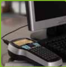
PC / Mac®